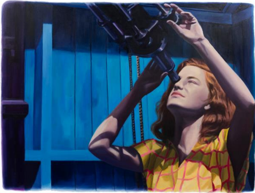
Katharina ZIEMKE Télescope, 2020 Huile sur toile, 90 x 120 cm (Portrait d'une anonyme)